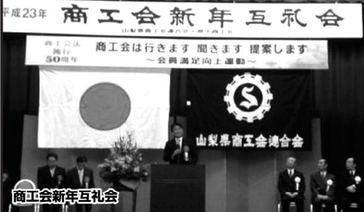
商工会新年互礼会