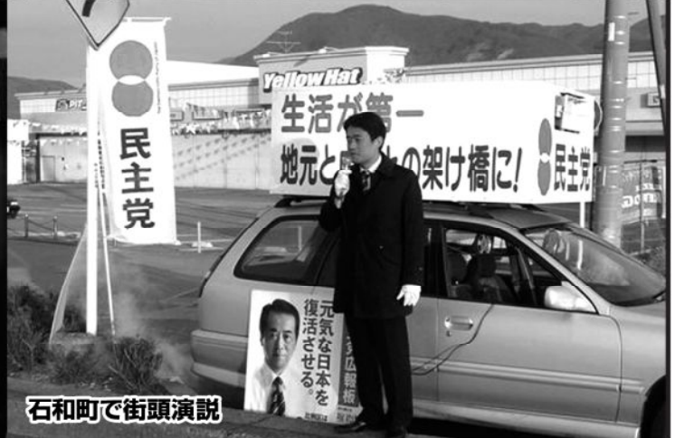
石和町で街頭演説