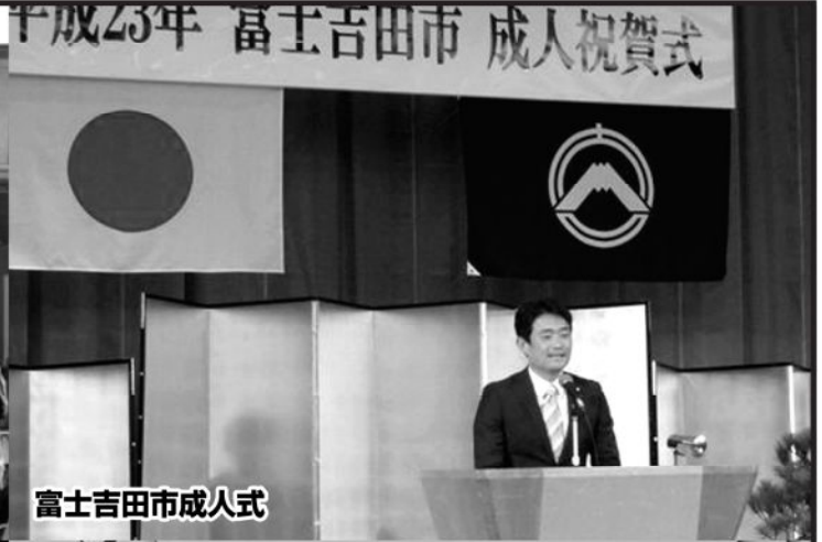
富士吉田市成人式