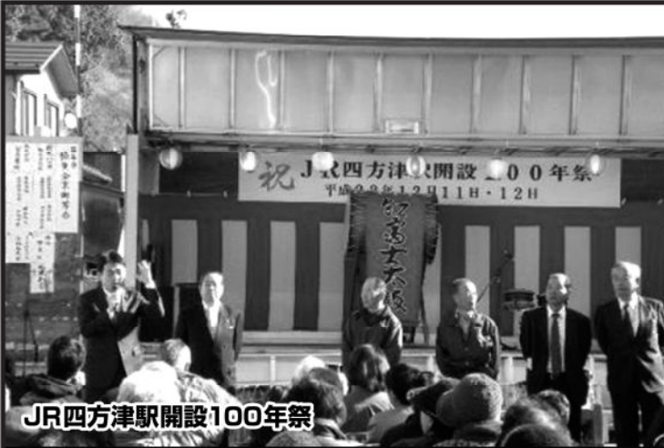
JR四方津駅開設100年祭