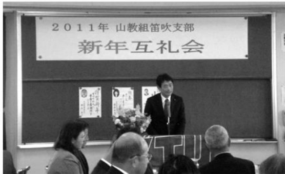
山教組笛吹支部新年互礼会