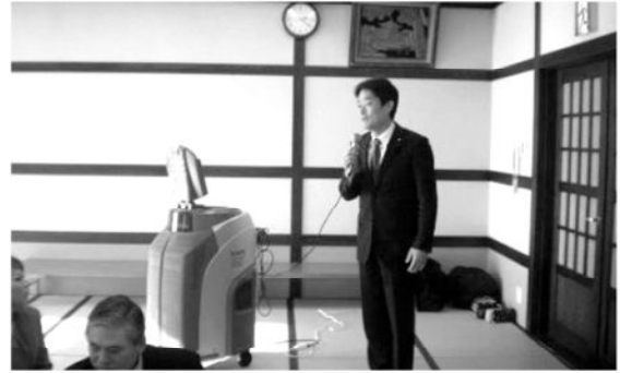
鳴沢村新年互礼会