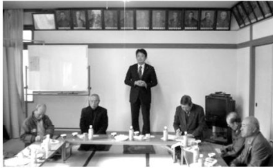
下部支部新年互礼会

私は、山梨2区と国会を結ぶかけ橋となり、地元の皆さまの思いを実現させるべく、粉骨砕身働いて参ります。